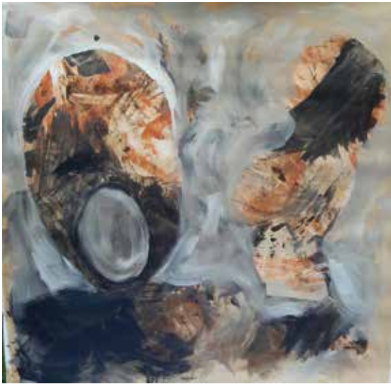
›Der Tanz ohne Schuhe‹ 150x150 cm, Mischtechnik auf Leinwand