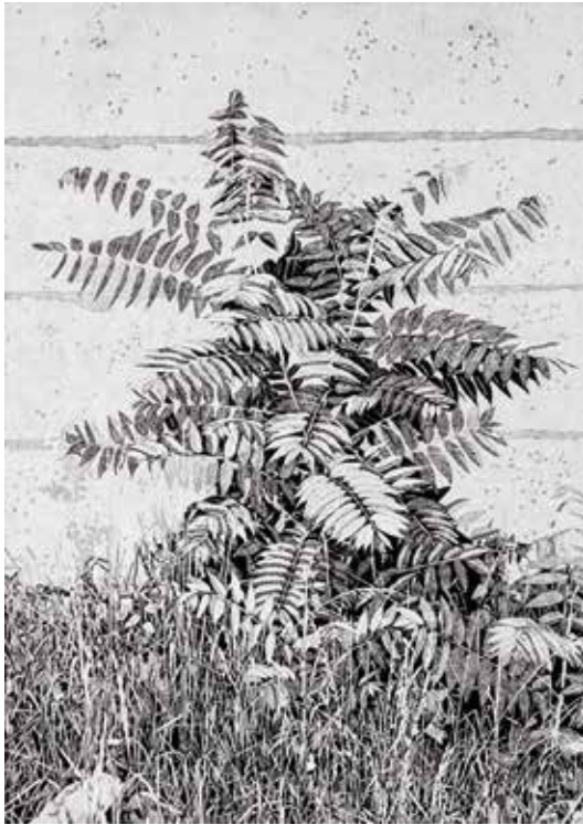
»Essigbaum«, 2017, Linolschnitt Reduktion, 6 Farben, Druck: 55x39,1 cm, Papier: 69x52 cm